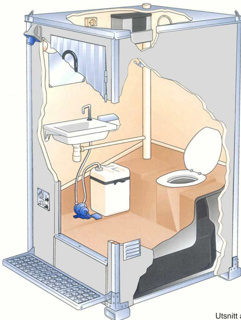
Utsnitt av en T-500.

Alle modeller er lette å flytte og transportere. Kabinene kan brukes permanent eller periodevis på til eksempel golfbaner, campingplasser og innen bygg- og anleggsbransjen.